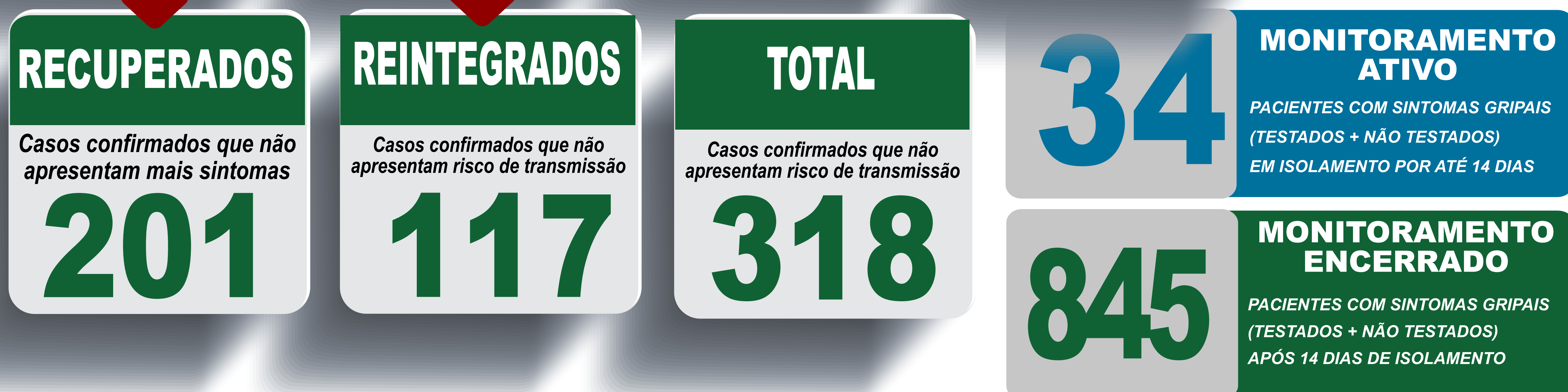
PLANILHA DE CASOS DE COVID-19 POR LOCAL DE RESIDÊNCIA, JABOTICATUBAS/MG