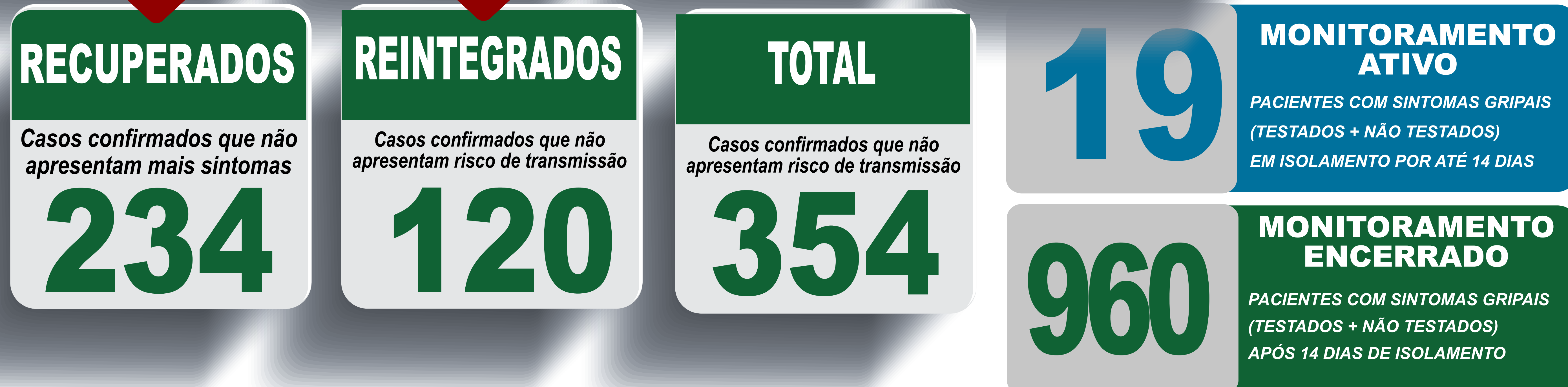
PLANILHA DE CASOS DE COVID-19 POR LOCAL DE RESIDÊNCIA, JABOTICATUBAS/MG