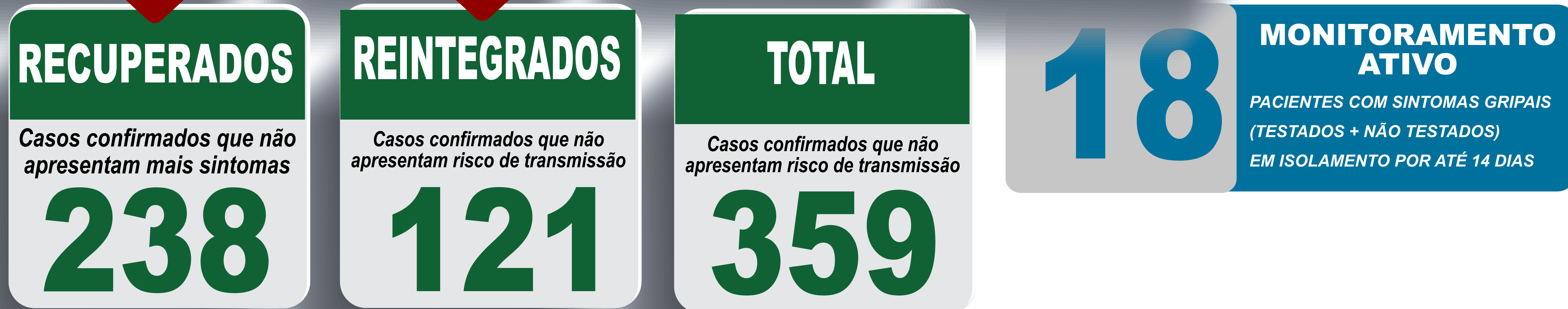
PLANILHA DE CASOS COVID-19 POR BARRIO/LOCALIDADE E RESIDÊNCIA, JABOTICATUBAS/MG