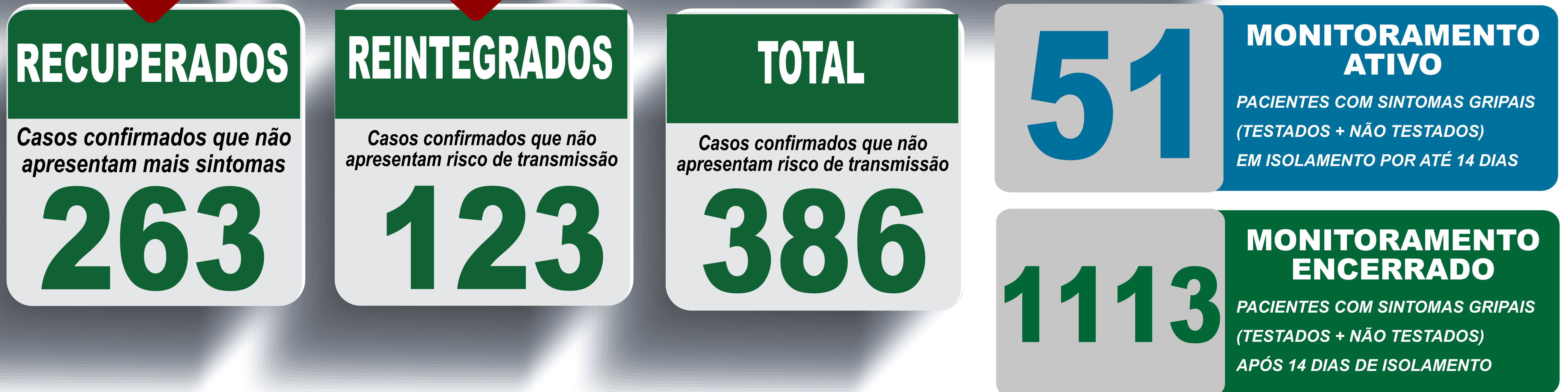
PLANILHA DE CASOS DE COVID-19 POR LOCAL DE RESIDÊNCIA, JABOTICATUBAS/MG