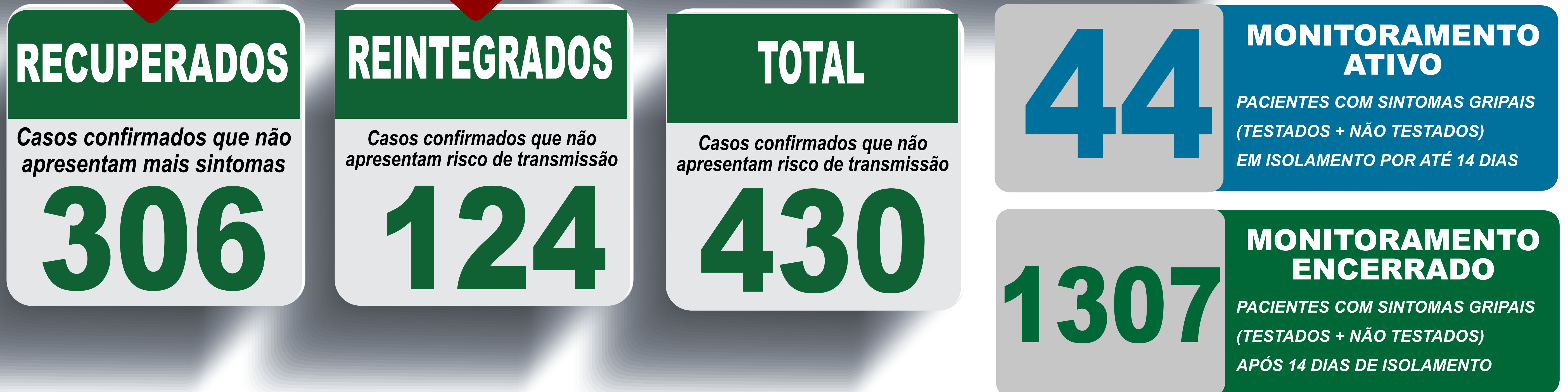
PLANILHA DE CASOS DE COVID-19 POR LOCAL DE RESIDÊNCIA, JABOTICATUBAS/MG