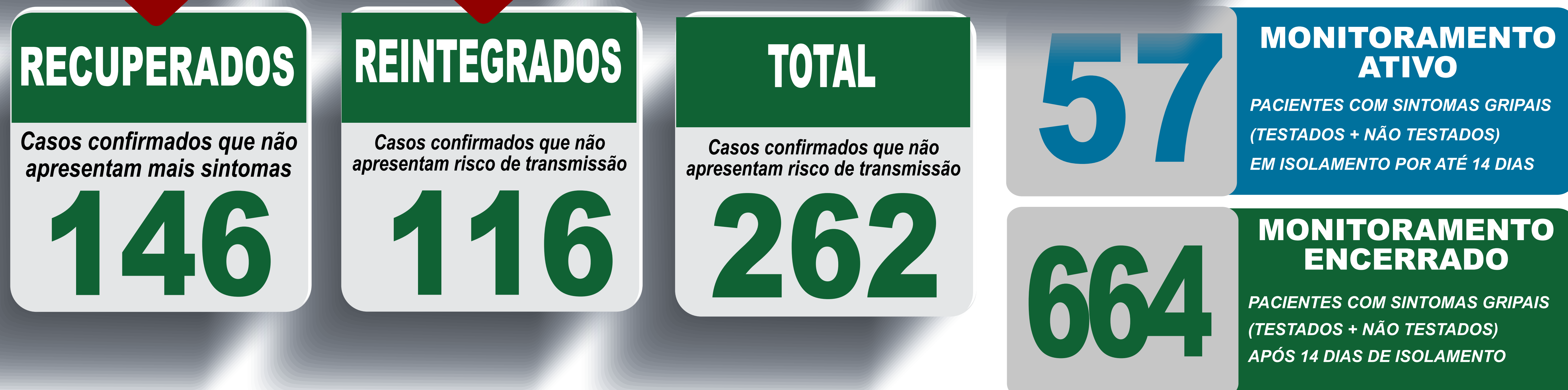
PLANILHA DE CASOS DE COVID-19 POR LOCAL DE RESIDÊNCIA, JABOTICATUBAS/MG