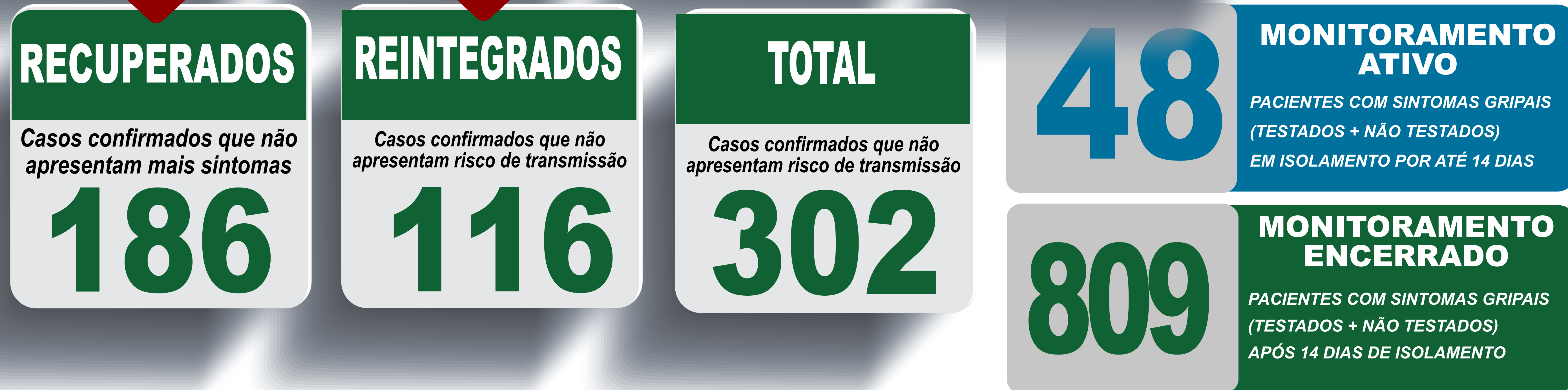
PLANILHA DE CASOS DE COVID-19 POR LOCAL DE RESIDÊNCIA, JABOTICATUBAS/MG