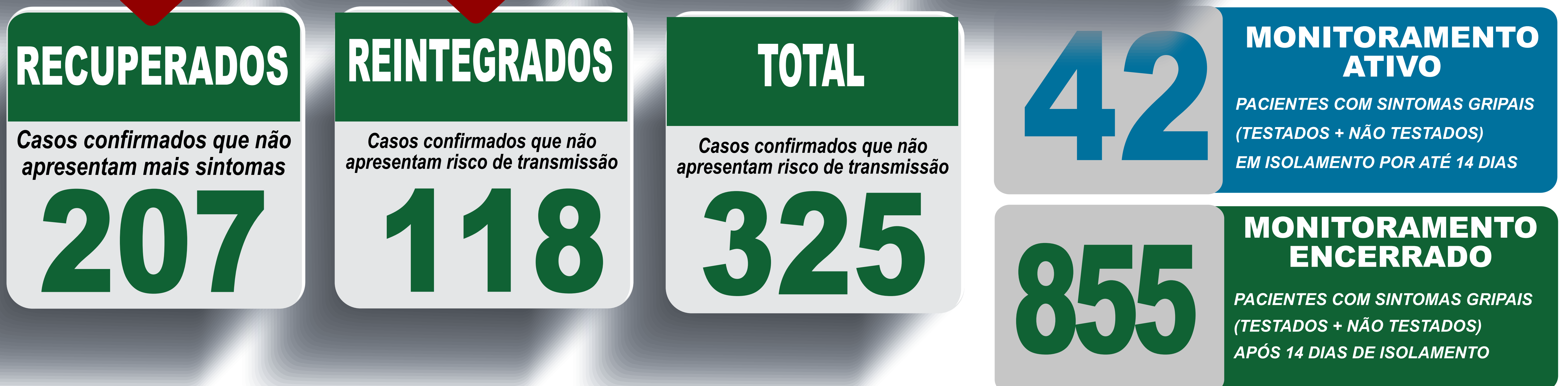
PLANILHA DE CASOS DE COVID-19 POR LOCAL DE RESIDENCIA, JABOTICATUBAS/MG